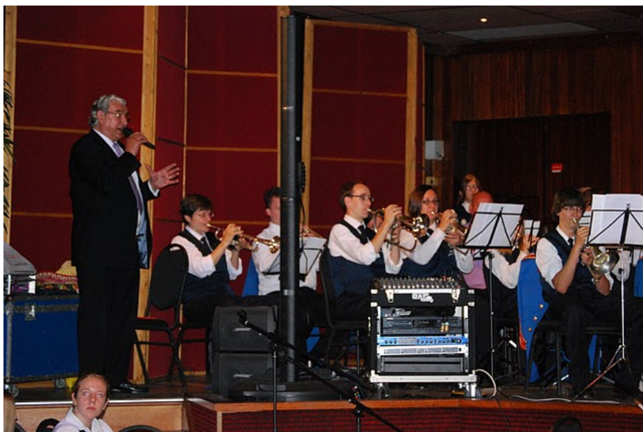
(Sjef Dieren en De Belvauer Jonge samen met ons)