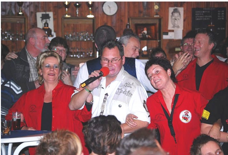
De Parkstadjodler verhogen met hun optreden de sfeer