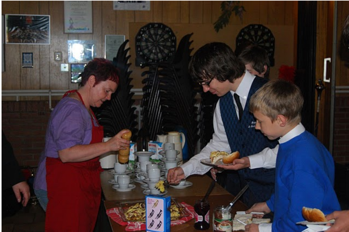
(Damescomitee verzorgt tussen de bedrijven door de innige mens)

Ons laatste optreden voor de grote vakantie was meteen een heel lange dag. Eerst om 09.00 uur de kinderen van Basisschool de Wissel muzikaal naar de kerk begeleiden. Dan genieten van een heerlijk ontbijt dat ons Damescomitee voor ons hadden klaar gemaakt zodat we gesterkt waren voor deze lange dag. Om 11.00 uur kinderen van Basisschool Kakertshofke naar de kerk begeleiden en tijdens de H.Mis spelen. Aan einde van de mis mochten de Communiekantjes weer met ons mee doen.