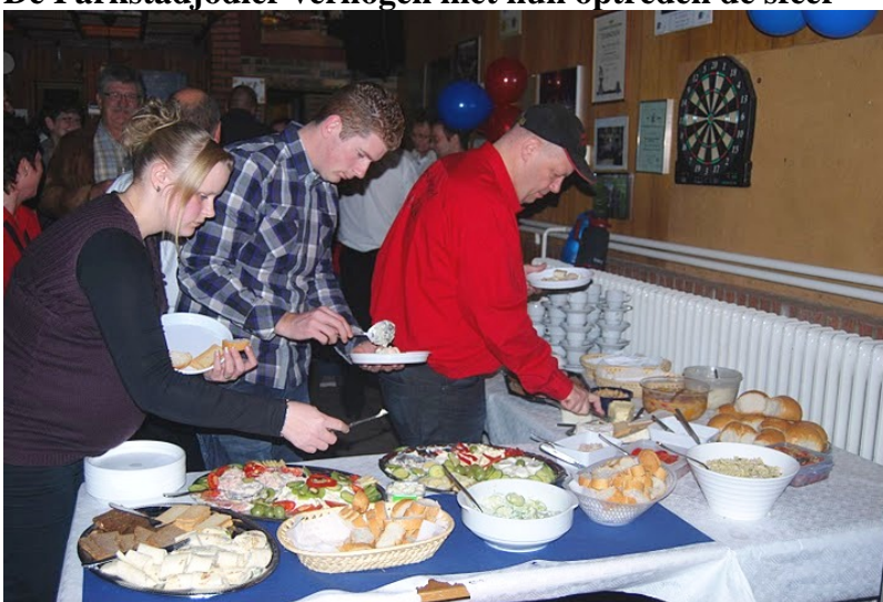
Het Buffet van het Damescomitee valt in de smaak.