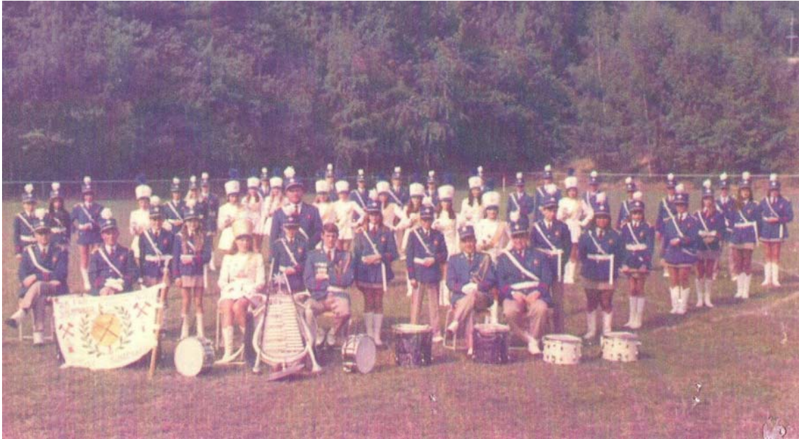
De vereniging in 1971: Foto ter ere van het behaalde Landskampioenschap