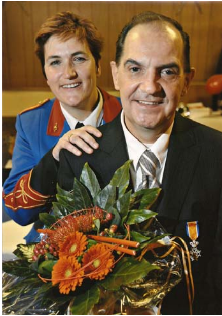
Math is geridderd