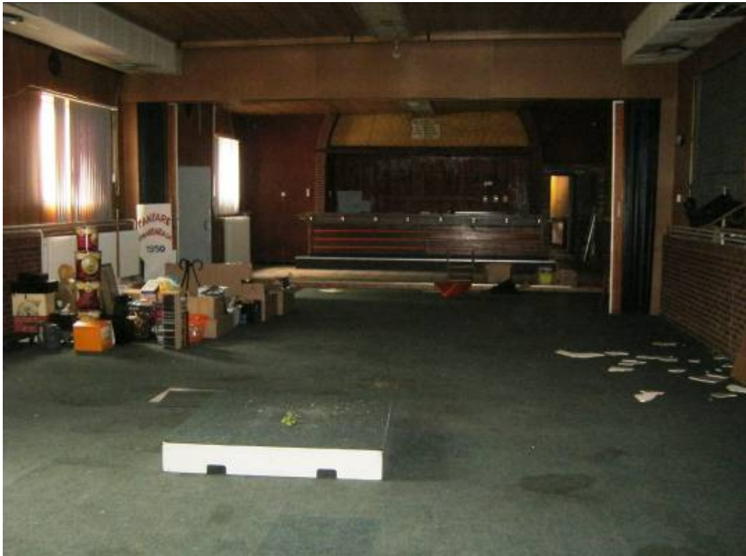
(Hier hetzelfde aangezicht nadat er gecontroleerd werd op asbest, juni 2011)