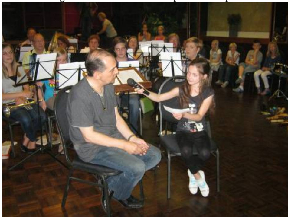
(Een leerling interviewde onze dirigent)

Ieder zou er zelf aan studeren en op de avond van de eindpresentatie zou het resultaat aan de ouders getoond worden. We kunnen terecht zeggen dat deze eindpresentatie in het Streeperkruis een succes was. Meer dan 40 kinderen kwamen om 19.00 uur naar ons repetitielokaal, samen met ouders en grootouders. Na het welkomstwoord van de directeur van Basisschool de Carrousel kon het feest beginnen. Ombeurten lieten kinderen en de fanfare horen wat zij op hun instrumenten geleerd hebben. Alles verliep in een ontspannen sfeer.