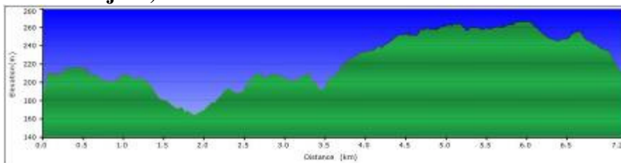
(Hier de hoogte profiel van de wandeling)