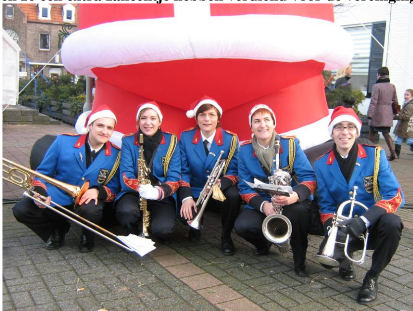
Het familie-ensemble tijdens de kerstmarkt.

Een van onze laatste optredens van het jaar is ook een van de leukste. Voor de 5 e keer gaven wij bij Zorgcentrum Heereveld een mooi kerstconcert. Voor het optreden hebben enkele leden in een ensemble tijdens de Waubachse kerstmarkt gespeeld. Zoals jullie weten heeft het Bestuur eerder dit jaar besloten, om in de toekomst kritische keuzes te maken onder de diverse aanvragen die binnenkomen. Velen weten onze fanfare inmiddels te vinden en dat doet de fanfare goed maar je moet het fanfare orkest niet overbelasten. Daarom bekijkt het bestuur welke optredens wel met de fanfare gedaan moeten worden en welke niet. Nou de kerstmarkt is zo'n optreden waarbij besloten is worden om dit niet met de hele fanfare te doen, omdat we al een concert op die middag hebben. Wel werden er enkele vrijwilligers gevonden die een uurtje op die kerstmarkt wilde musiceren en zo een extra zakcentje hebben verdiend voor de verenigingskas.