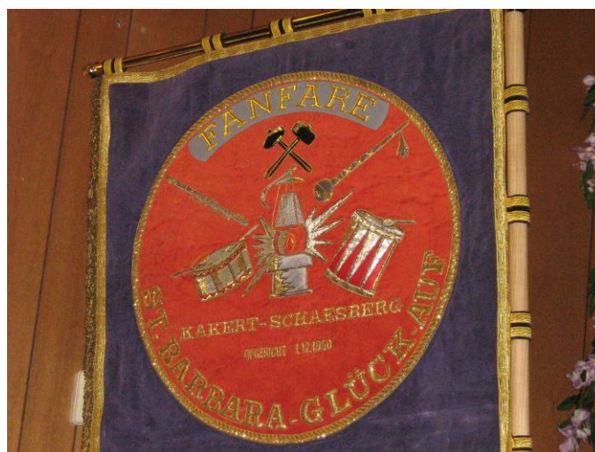
Het Vaandel met de aangepaste naam.