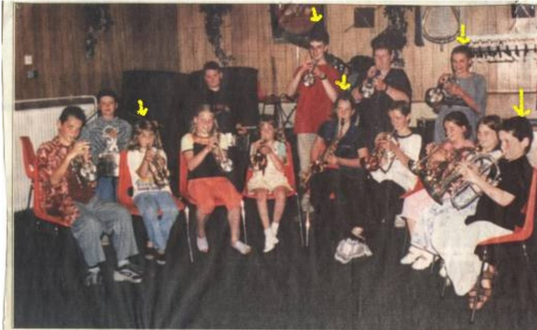
• De jeugd van St. Barbara in actie.

Maar voordat we zo ver kwamen dat het orkest anno 2010 bestaat uit maar liefst 37 spelende leden (en dus niet meer de kleinste fanfare van Landgraaf is) moesten er leerlingen geworven worden en dat gebeurde o.a. op Basisschool Prins Willem Alexander en Basisschool Kakertshöfke.