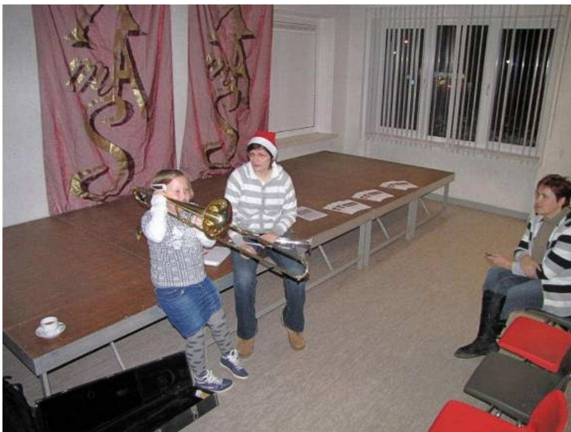
Een meisje probeert haar geluk op de trombone.

In de gymzaal gaven we een 'workshop' waar kinderen konden proberen zo lang mogelijk op een trombone te spelen. Ook hier was weer het probleem dat de gymzaal te ver weg lag van het centrale gebeuren en er geen aanwijsborden waren met de activiteiten op. Daardoor vonden niet genoeg kinderen de weg naar deze Aktie. Onze muzikale bijdrage aan de kerstmarkt was wel een groot succes. Op de klanken van bekende kersthits werd door de mensen actief mee gezongen. Ons kerstconcert viel duidelijk in de smaak.