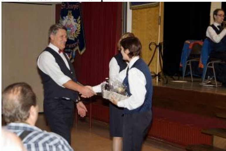
De instructeur ontvangt ons presentje

We hadden voor de drumband van St.Joseph en haar 2 slagwerksolisten een kleinigheid meegenomen. Daar de drumband Limburgs Kampioen was geworden en de 2 solisten zelfs Nederlands Kampioen.