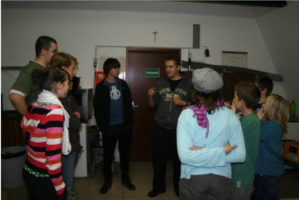
Iedereen doet mee tijdens de spellen van de Lama's

Jammer dat na thuiskomst velen ziek zijn geweest, misschien iets verkeerd in het eten 😊😊 of de Mexicaanse griep 🤒🤒🤒