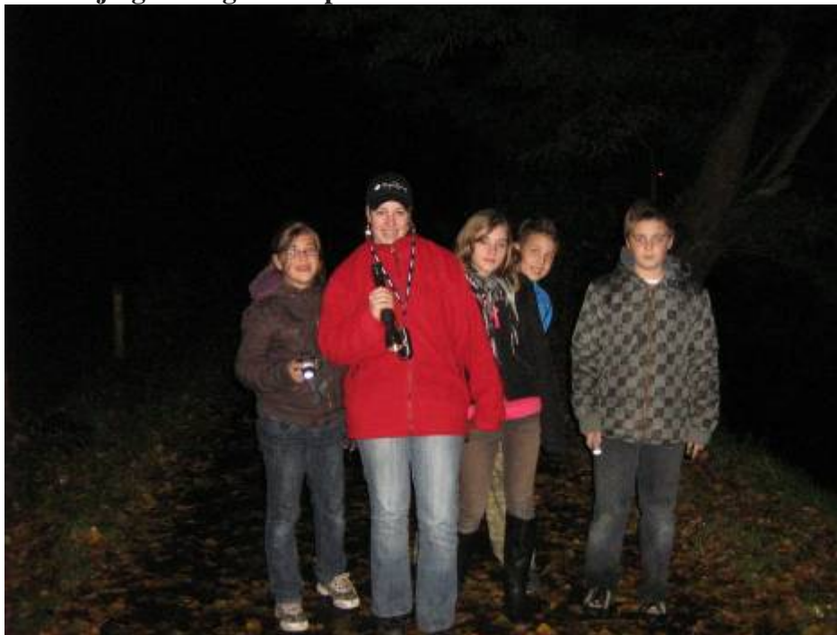
Ook werd er een dropping gehouden

Complimenten aan de jeugdcommissie, de vrijwilligers en de jeugdleden voor de goede organisatie.