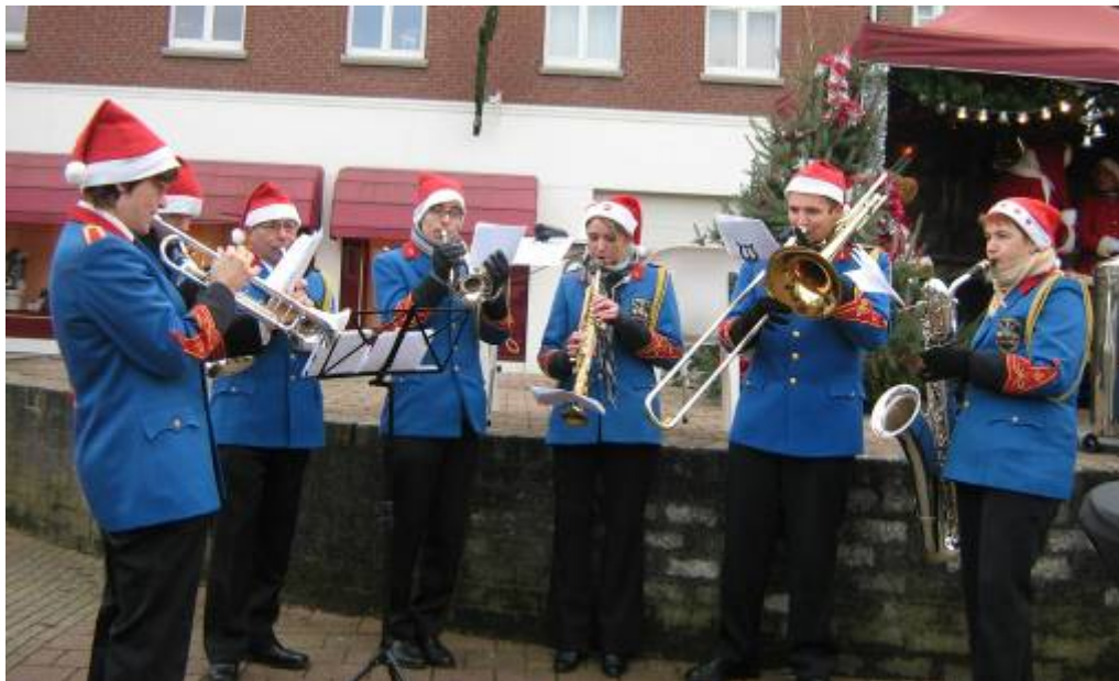
Het ensemble in Aktie op de kerstmarkt in waubach

Zondag 13 December stond het traditioneel kerstconcert in Zorgcentrum Heereveld op het programma. Vooraf werd er met een ensemble ook nog een uurtje gemusiceerd op het Waubachs kerstmarkt. Dit om weer de verenigingskas te spekken.