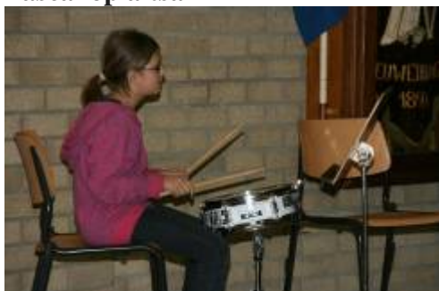
En Desirée op kleine trom