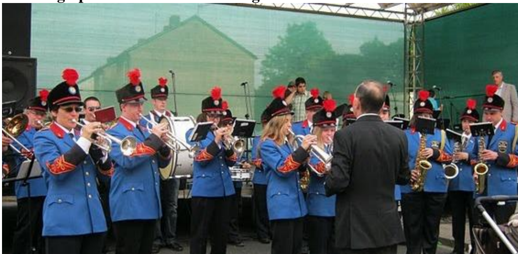
Ons optreden in Setterich

Vrijdag 6 mei vertrokken we met een gesponsorde bus naar Setterich, waar wij de festiviteiten van het stadsfeest muzikaal moesten omlijsten. Voor dit optreden werden wij benaderd door onze koster uit de Kakert. Hij had nog een speciaal verzoek, of wij de Steigermars wilde spelen. Vooraf werd door de organisatie aan het publiek verteld dat wij vorig jaar dit muziekstuk in bijzijn van koningin Beatrix gespeeld hadden in Den Haag.